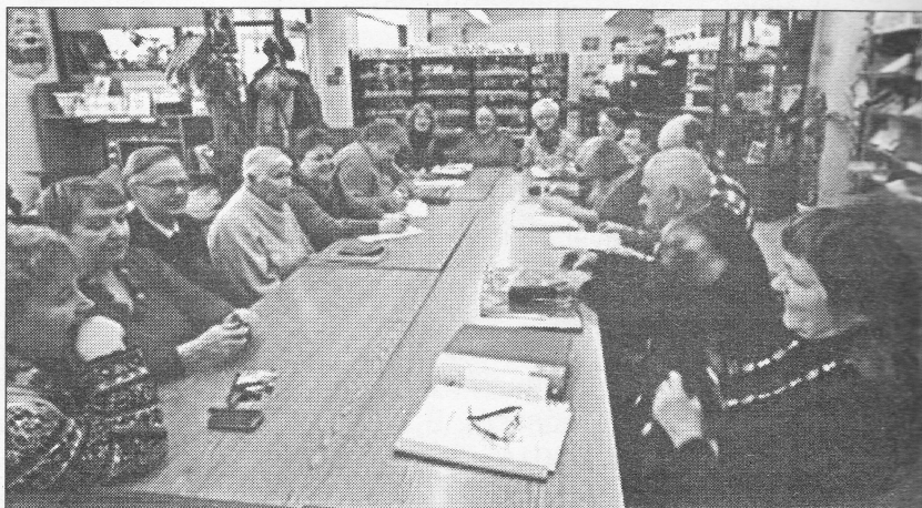
Заседание кружка «Древо жизни»

«С чего начать создавать семейный архив? Начните с хорошо известного – с самого себя, ведь вы представляете собой начальную веточку семейного дерева. Соберите данные о родителях, запишите их, далее – сведения о ваших дедушках и бабушках, а затем – о более ранних поколениях. Ищите информацию сначала дома – в документах, свидетельствах о рождении и смерти, заключении брака, дневниках, письмах, записных книжках, на оборотах фотографий и в альбомах, в вырезках газет. Составьте список ближайших родственников, напишите их имена и фамилии, по возможности – места